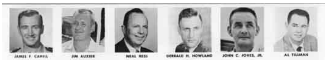
Il primo Board of Directors NAUI (1960)